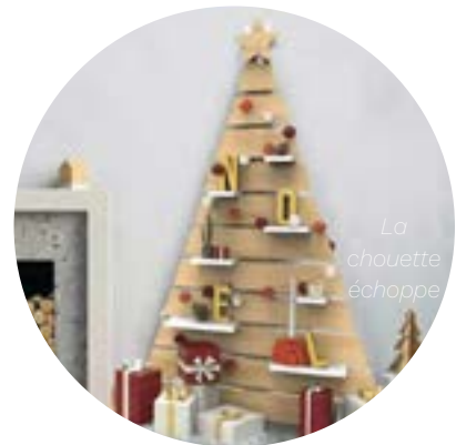
Palette de bois déconstruite