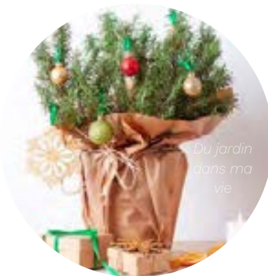
Plant de romarin décoré