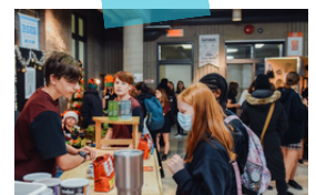
Collège Mont-Saint-Louis, 2022

Pendant le temps des Fêtes, partagez vos produits faits maison en organisant un marché des Fêtes écoresponsable entre les membres de la communauté éducative.